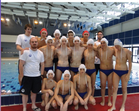
L'équipe de l'ouest :

Zone: Nord, Méditerranée, CIF, Sud-ouest, Est, Ouest