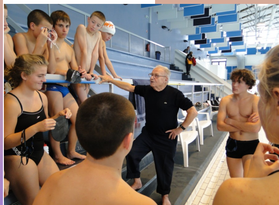
STAGE à LAVAL EN OCTOBRE 2011

Des résultats d'autant plus encourageants que cette équipe est la plus jeune de la compétition!