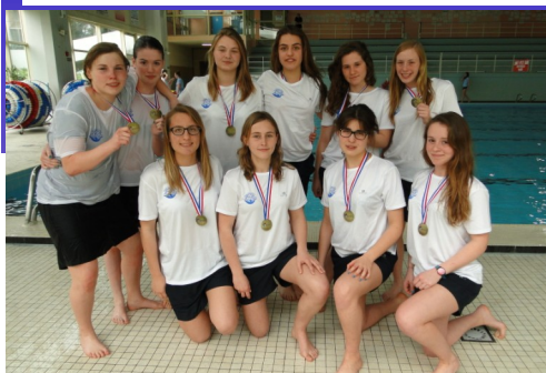
Les filles se bronzent à LONGWY!