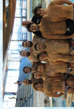
Plan spécial de Polo